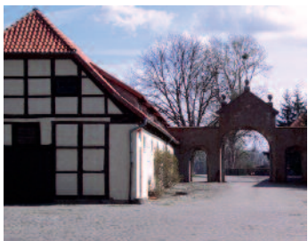
Gut Bockerode 31832 Springe-Mittelrode

Niewielka odległość od Hanoweru umożliwia również szybki dojazd z zagranicy!