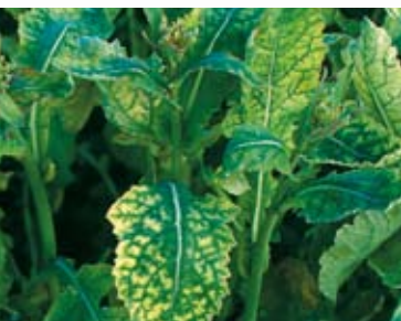
niedobór siarki w rzepaku

© = zarejestrowany znak produktu, K+S KALI GmbH