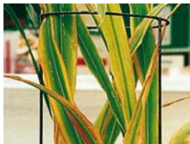
niedobór siarki w kukurydzy