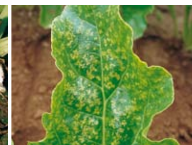
niedobór manganu w burakach cukrowych