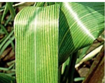
niedobór magnezu w kukurydzy