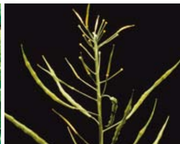
niedobór boru w rzepaku