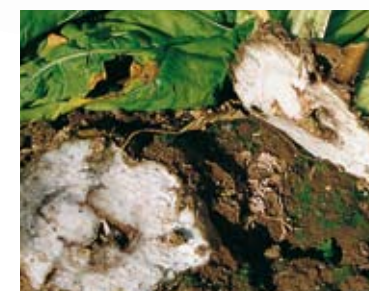
niedobór boru w burakach cukrowych