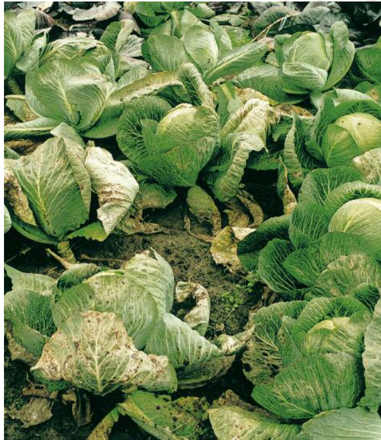
Zwavelgebrek bij wittekool

Groentegewassen zoals uien en prei, koolsoorten, erwten en bonen hebben een grote zwavelbehoefte die door minerale meststoffen moet worden afgedekt. Daarvoor zijn sulfaathoudende kalium- en magnesiummeststoffen het beste geschikt, omdat zwavel alleen in deze vorm direct door de plant kan worden opgenomen en omgezet.