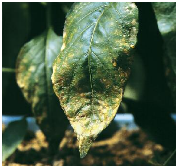
Kaliumgebrek bij paprika