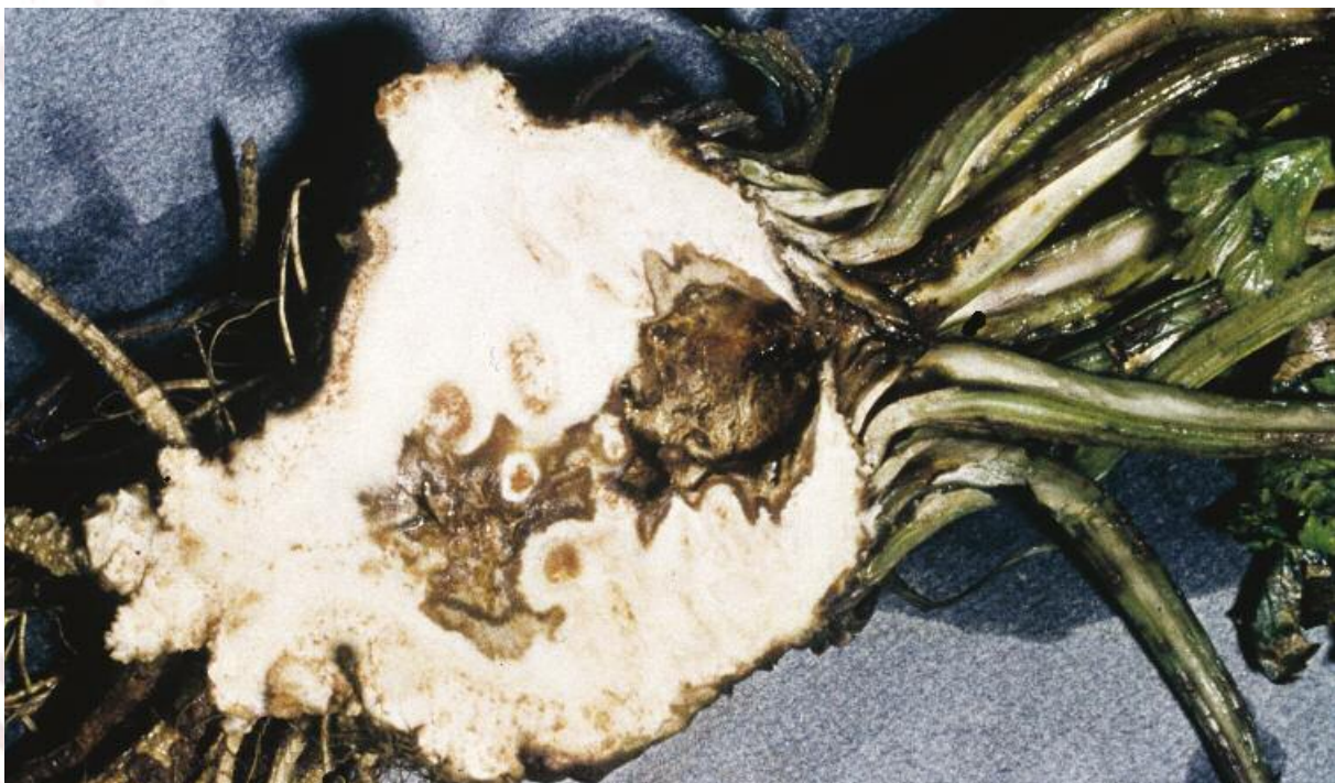
Boriumtekort bij selderie

Een tekort aan micronutriënten laat zich effectief en snel verhelpen door de toepassing van bladbemesting. Door de toediening rechtstreeks op het blad wordt het gevaar omzeild dat de meststof in de diepere bodemlagen terecht komt of aan de bodem wordt gebonden; de nutriënten komen zonder omweg daar terecht waar ze nodig zijn.