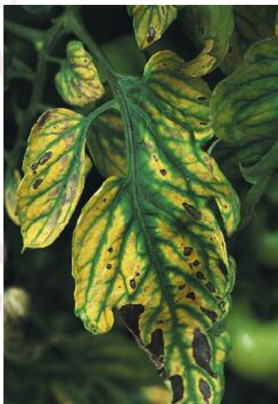
Magnesiumgebrek bij tomaten

Zo voerde bij bladspinazie een behandeling met EPSO Microtop ( MgSO_4 met zwavel en borium en mangaan) tot snelle en duurzame intensivering van de kleur van het blad en daardoor tot hogere kwaliteit van de producten.