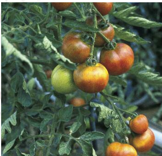
Kaliumgebrek bij tomaten

Kaliumsulfaatmeststoffen van K+S KALI GmbH zijn chloridearm en worden daarom zeer goed verdragen door jonge planten en zoutgevoelige gewassen.