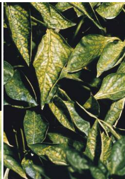
Magnesiumgebrek bij paprika