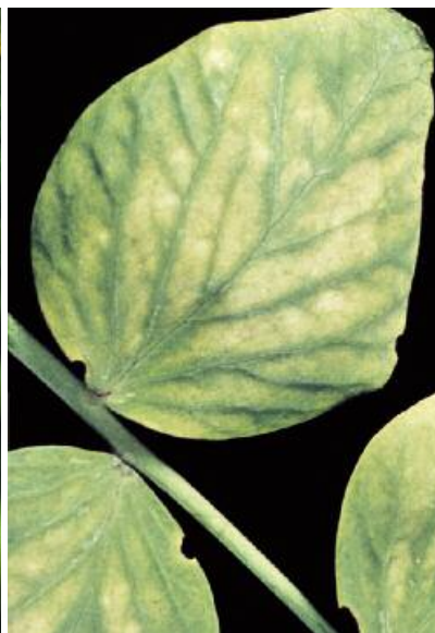
Magnesiumgebrek bij erwten