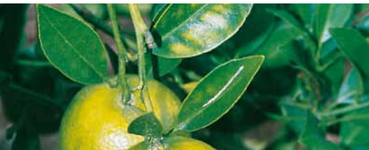
Τροφοπενία Μαγνησίου στα εσπεριδοειδή

Για τον λόγο αυτό, η έγκαιρη εφαρμογή του EPSO Top® εξασφαλίζει την επαρκή προμήθεια της καλλιέργειας με τα θρεπτικά στοιχεία ακόμα και κατά την διάρκεια των κορυφαίων απαιτήσεων σε αυτά διασφαλίζοντας τις υψηλές αποδόσεις.